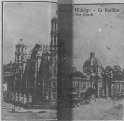
Hidalgo - La Basílica The Church

Por eso, lector, los argonautas armados en corso como un centinela avanzado de la patria, no era ocasión esa jula que el insolito pasaje surcan los revueltos mares de México, para que hombre de su condición, toreando el día y de la Historia, me dan tártagos; pero en cambio, se fuera por los cerros de Ubeda que no han de faltar uno por lo otro, cuando un escritor discreto, avezado de Anáhuac, á cantarle villancicos á miscas y sapotecas , la respectiva odisea á ennegrecer cuartillas, anuncia de podrás inferir sin gran esfuerzo que la colosal figura de de un tomo en octavo, con ó sin viñeta, que de eso se me da Cortés, cuya sola consideración avasalla y suspende el ánimo, surge á cada paso por entre las páginas del libro en que tú y