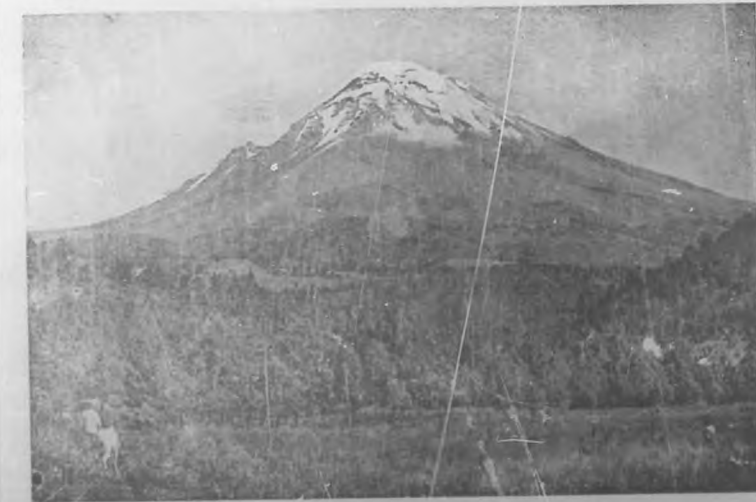
El Volcán de Orizaba