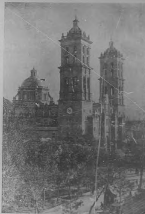
Catedral de Puebla

De aquella identidad habían muy alto hasta certificar enaplidamente su existencia, la concisión de la frase, que en libro y periódico llega, sin mengua de la claridad, á dar en los linderos de la sobriedad lacónica, y la precisión desesperante de aquellos renglones cortos y certeros como rifles, que nunca yerran porque el hábil tirador que los maneja, más afortunado que el príncipe de