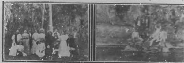
Grupos pertenecientes á la gira que se llevó á cabo días pasados en el pintoresco punto llamado Salto de San Vicente la cual estuvo animadísima.

Siempre recordamos que gracias á la empresa Lambardi hemos conocido tres óperas nuevas para nosotros.