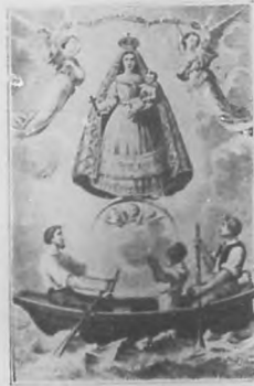
Ntra Sra. de la Caridad