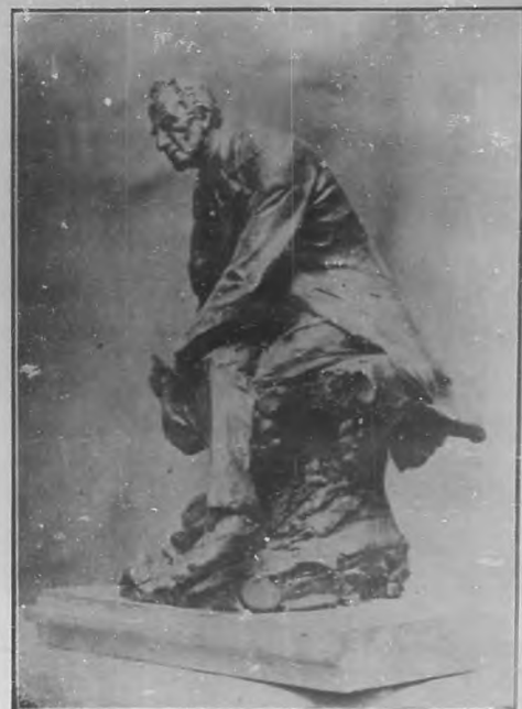
Otro lado de la estatua.