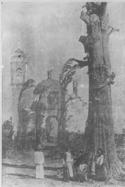
En el campo

Sin perjuicio, lector, del saludable espanto que me inspiran con sus obras algunos autores sedentarios cuyo nombre no me place traer ahora a colación hay en la República de las letras ciertos escritores semovientes, de quienes puedo asegurarte que apenas hacen alto para refrescar sus Recuerdos de los Antipodas , ó sus Impresiones de la Mesopotamia , inunden en mi ánimo tan desordenado apetito de locomoción, que sin poderlo evitar, acabo por ponerme en cobro emprendiendo el vuelo hacia las hospitalarias regiones de Villadiego.