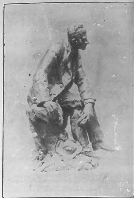
La estatua vista de lado.