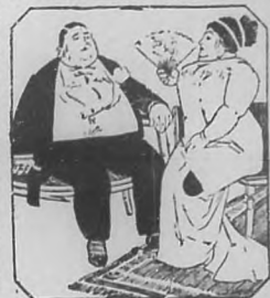
La gordura es peligrosa y ridícula

Precios módicos, con todo servicio. A una cuadra del Parque y Teatros.