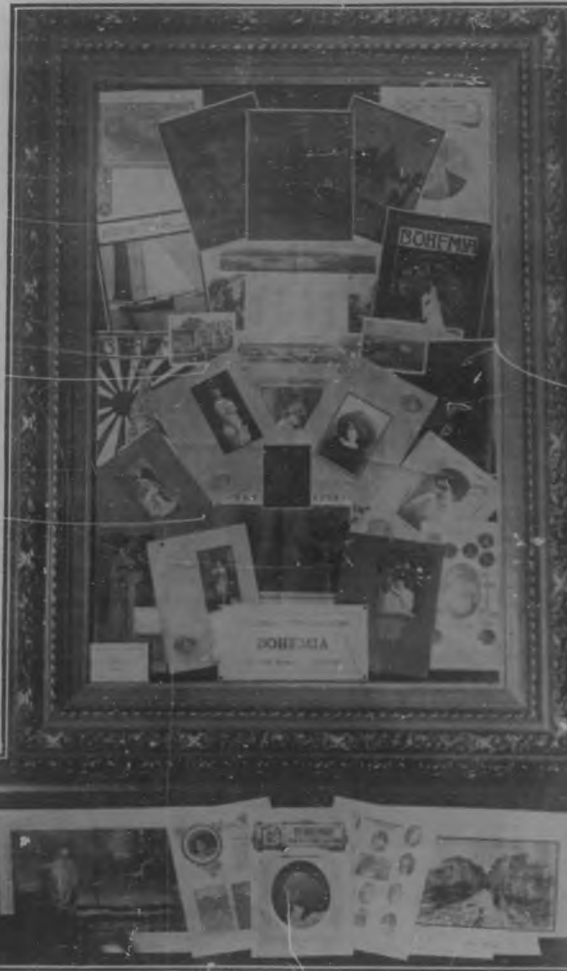
Instalación de BOHEMIA en la Exposición Nacional

Un album, un recuerdo de la Exposición, es indispensable. Todas las Exposiciones pequeñas y grandes, han quedado perpetuadas gracias al album. BOHEMIA así lo entiende y por eso ha imaginado un album; pero que no sea un “catálogo”, que sea algo más.