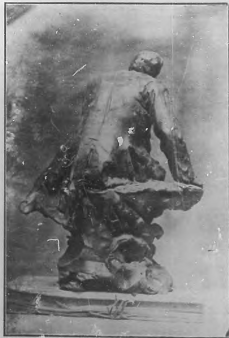
La estatua vista de espalda.

Por fin, repetimos, la obra está ya en su conclusión. Un escultor francés—Julián Lorieux—ha modelado el boceto y la estatua será muy pronto