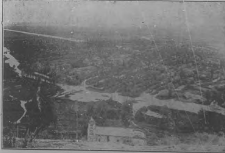
Terrenos de Ajo y la capilla de Hernan Cortés

Y porque no me meces que andan por ahí, á hurtadillas, de incógnita, á veces exóticos la lumbre de meollo porque á algún día se abrasen las bro de Rivero traigo mosos escarceos per... será declarar á tiempo tuya y de otros